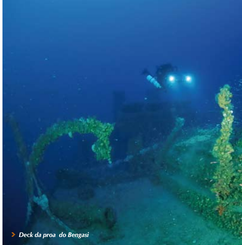
Deck da proa do Bengasi

O canhão de popa encontra-se intacto, sempre repleto de vida marinha, milhares de pequenos peixes vermelhos o rodeiam, após nadarmos sobre a cobertura da popa, dirigimo-nos para os porões onde se encontram os cristais, é um local dos mais belos que conhecemos se não o mais fantástico. A entrada encontra-se coberta por redes e pequenos fios de pesca que se podem tornar armadilhas com a suspensão que se levanta após a nossa passagem. Quando entramos nos porões o ambiente altera-se completamente, a escuridão envolve-nos, o fundo está cheio de lodo e repleto de objectos de vidro e cristais, como copos, cálices, jarras, castiçais, vasos, frascos etc, etc. São milhares e milhares que preenchem todo o fundo, o reflexo e o ambiente que fazem com as nossas luzes é misterioso e maravilhoso, parece um tesouro perdido, nós temos que estar praticamente colados ao tecto baixo, de forma a não tocar nos vidros e evitar levantar suspensão, o perigo de nos cortarmos é bem real, mas vale bem a pena.