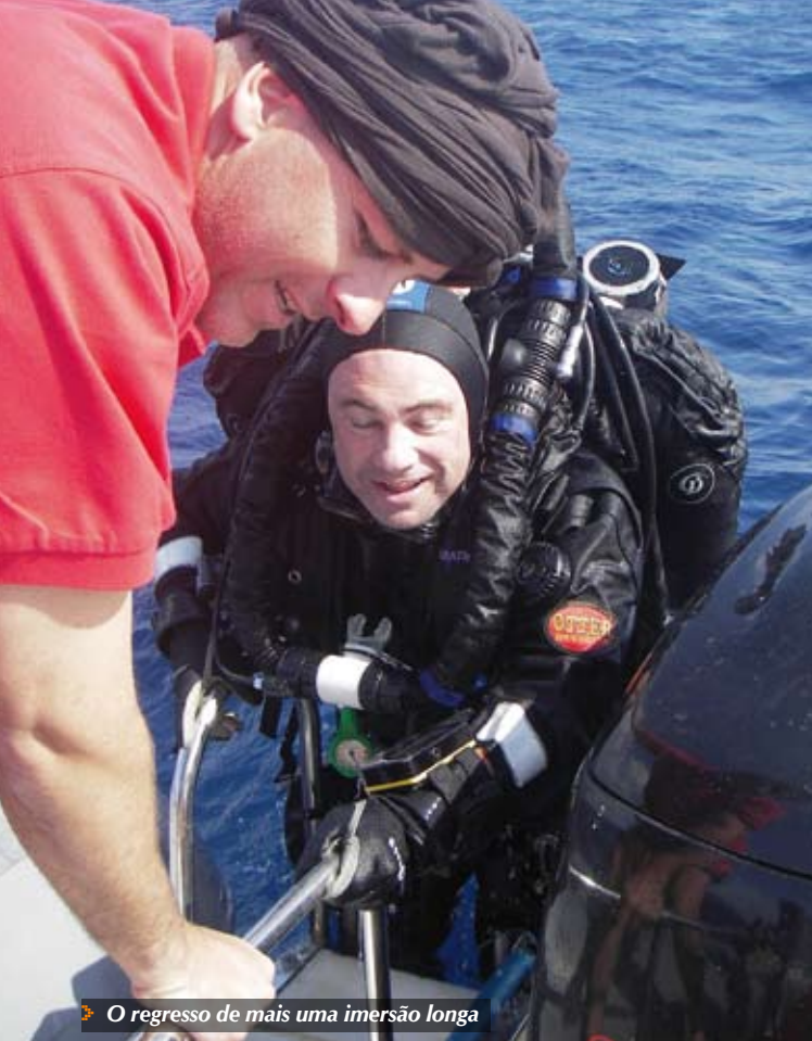
➤ O regresso de mais uma imersão longa

sentimos como são frágeis, é um local pesado mas muito delicado ao mesmo tempo, em seguida percorremos alguns varandins da estrutura principal, tentando imaginar quem os teria pisado, e gozado das belas vistas, ao longo deste inúmeras vigias estavam abertas mostrando o interior de algumas cabines.