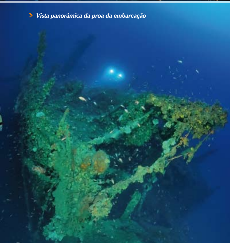
➤ Vista panorâmica da proa da embarcação