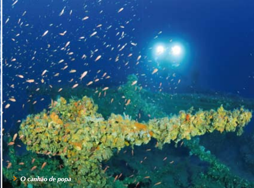
➤ O canhão de popa