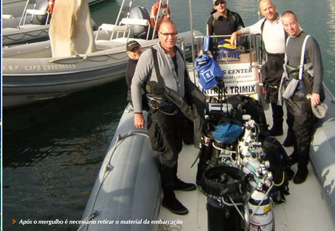
➤ Após o mergulho é necessário retirar o material da embarcação

Depois dos porões nadámos em direcção á proa, que fica bem mais á frente, quase 60 metros, para lá chegarmos tivemos de passar pela ponte de comando, esta já em colapso, e toda a zona de passageiros, onde se encontram inúmeras divisões e corredores para explorar noutros mergulhos, no topo do navio encontra-se caída a chaminé e mais na frente avistamos os