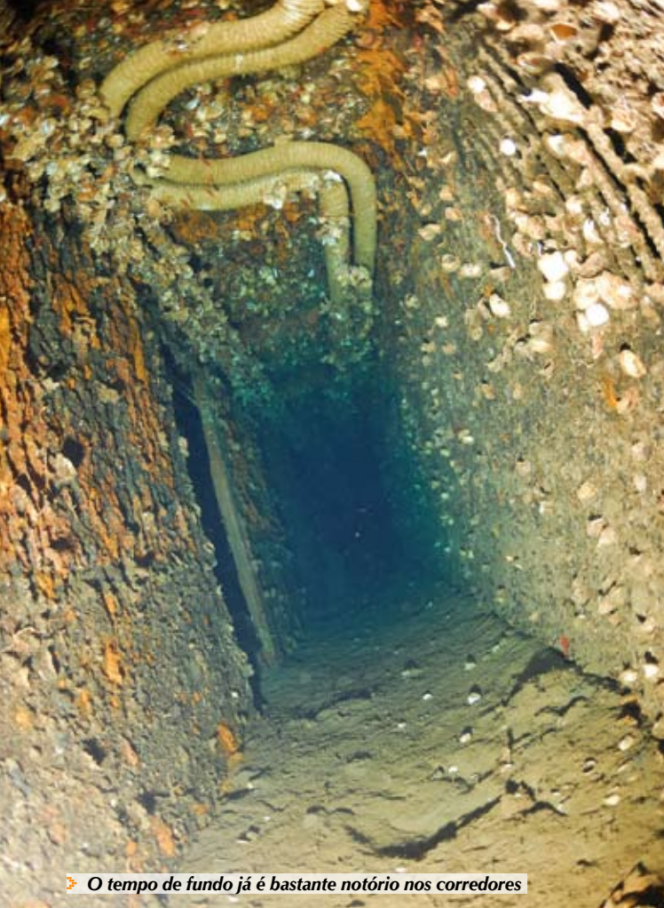
➤ O tempo de fundo já é bastante notório nos corredores