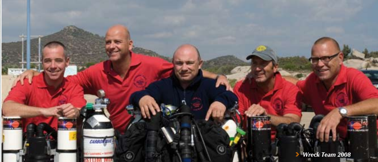
Wreck Team 2008