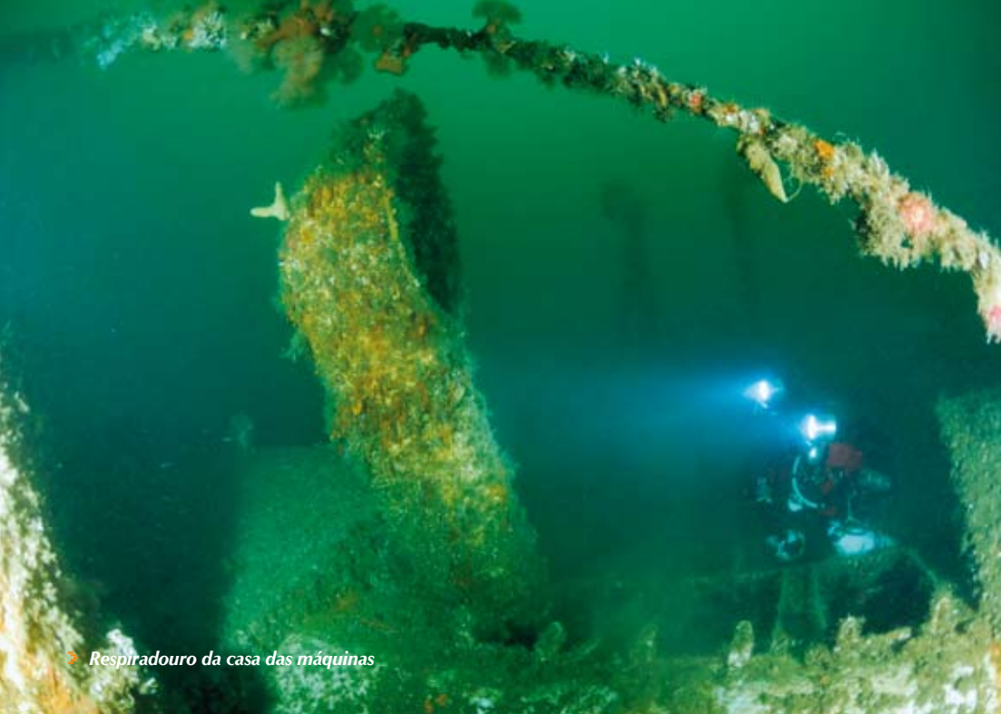
➤ Respiradouro da casa das máquinas

estar tombado, o que dificulta muitas vezes a orientação. Como temos pouco tempo optámos por não entrar e tirar antes algumas fotos de ambiente ou de alguns objectos mais interessantes de registar.