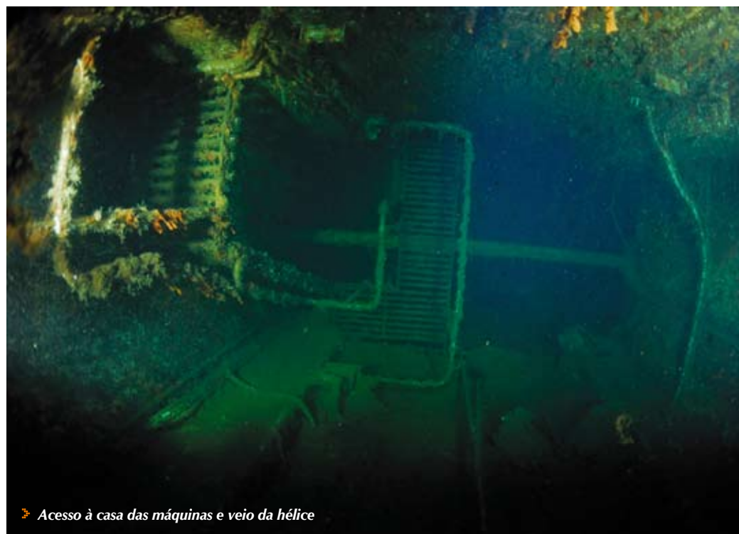
➤ Acesso à casa das máquinas e veio da hélice