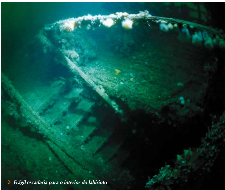
➤ Frágil escadaria para o interior do labirinto

Nós escolhemos mergulhar na zona da popa até meio navio, a visibilidade era cerca de 10m, o barco está inclinado cerca de 45 graus para o lado de bombordo, tem 2 níveis de decks , inúmeros corredores e algumas portas por onde se pode entrar, mas é um naufrágio perigoso, derivado ao seu interior ser labiríntico e >>