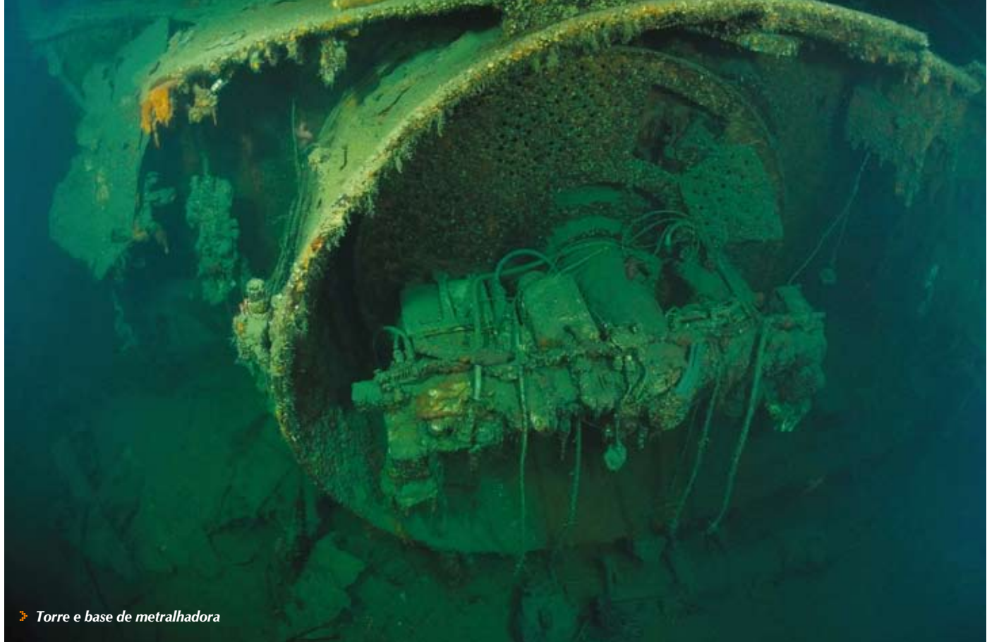
➤ Torre e base de metralhadora