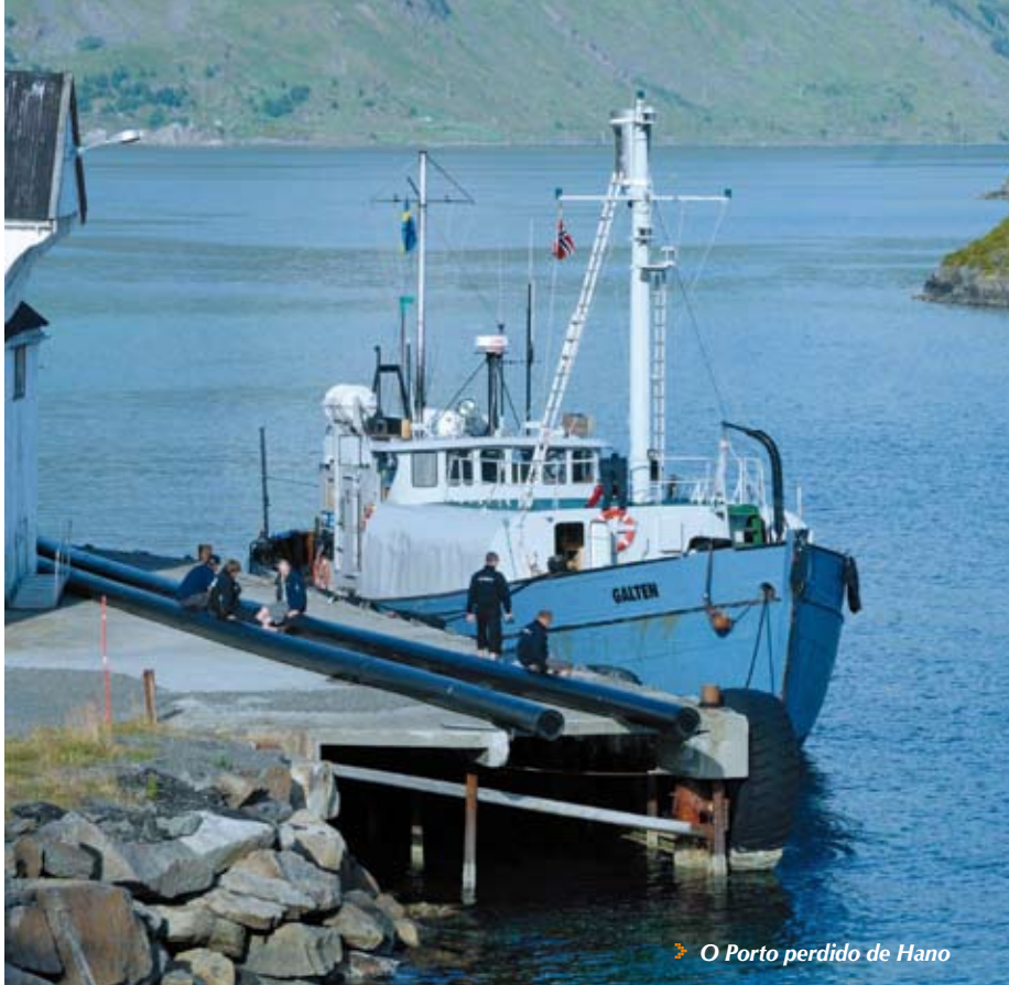
➤ O Porto perdido de Hano

assim um dos membros da tripulação irá sozinho prender o cabo ao destroço para que possamos descer em seguida.