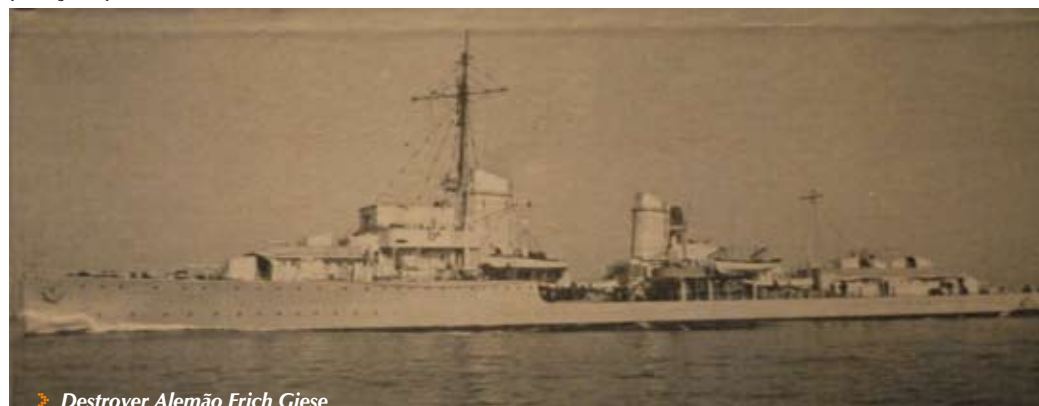
✦ Destroyer Alemão Erich Giese

Por grupos saltámos para a água. Esta encontra-se gelada, a 5°C, a visibilidade é algo turva, mas à medida que vamos descendo vai tornando-se melhor e a luminosidade perde-se por completo, até que surge vindo da profunda escuridão o nosso navio. Encontra-se tombado de bombordo e a